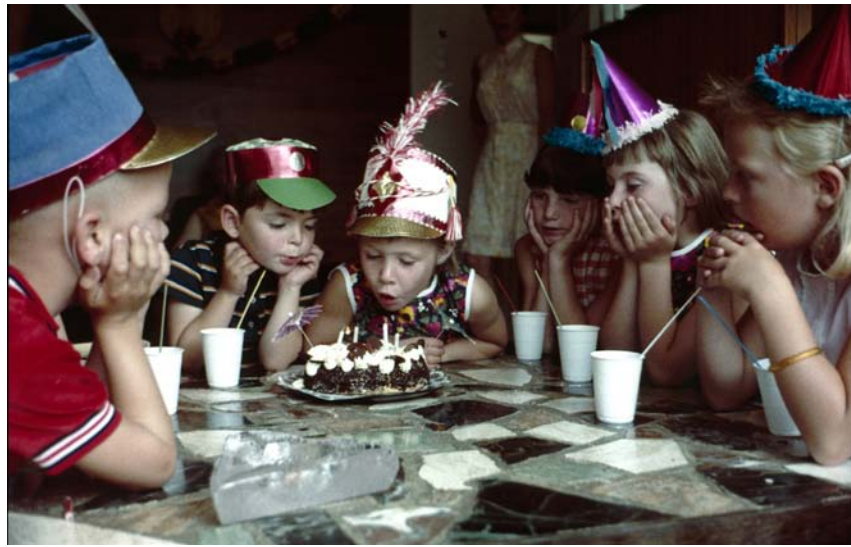
74.033. Polyvisie. Verjaardagspartijtje, circa 1965

afbeeldingen uit de periode 1930 tot 1990, met de nadruk op de jaren zestig. Een belangrijk gedeelte van de beelden is gemaakt om educatieve series te illustreren. Daarbij komen alle onderwerpen aan bod die op scholen werden onderwezen. Een serie bevatte zes, twaalf, vierentwintig of soms nog meer beelden. Restmateriaal werd in een filmblik opgeslagen. Een gedeelte daarvan werd gebruikt voor de illustratie van boeken. Daarmee ontstond een uitgebreid stockarchief. Anders dan de journalistieke opnamen van collecties als die van Spaarnestad en ANP, waarbij de nieuwswaarde van oorsprong een belangrijk element is, brengt het educatieve beeldmateriaal van Polyvisie een onderwerp volledig in beeld. Daardoor geven ze nu een uniek, samenhangend beeld van het dagelijks leven in een verleden tijd. Zo is er een serie die toont hoe de PTT werkte en in dat kader de gehele bedrijfsvoering in beeld brengt. Educatief en onderhoudend, maar vandaag de dag is het ook een tijdreis. De beelden tonen de handmatig bediende telefoonschakelkasten, ouderwetse kantoortuinen, houten sorteerkasten, voormalige PTT-uniformen, in onbruik geraakte postbussen en meer. In een setting van de jaren zeventig, met een ander straatbeeld, andere kleding, andere auto's en andere mensen. Kortom: een andere tijd. Naast de veelal door eigen fotografen vastgelegd beelden, zijn er series