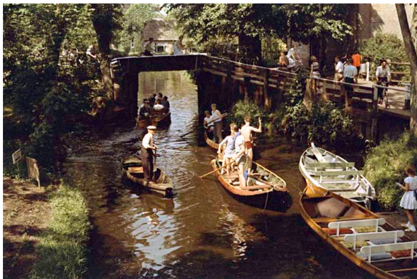
74.030. Polyvisie. Giethoorn, circa 1955

Polyvisie is door de jaren uitgegroeid tot een belangrijke producent van educatieve audiovisuele producties. Maar als rond 1995 de profetie van internet en digitaal onderwijs steeds luider worden verkondigd, voelt de directie dat ze deze slag niet meer kan en wil maken. Na enkele pogingen om geschikte partners te vinden, wordt het bedrijf verkocht en het archief opgeslagen. Uiteindelijk komt Polyvisie in handen van een voormalig medisch directeur van een farmaceutisch bedrijf. Hij wil via de bestaande contacten met scholen zijn verhaal verkondigen over diabetes, dat volgens hem de toekomstige nummer één volksziekte is. In het archief is hij niet geïnteresseerd en hij laat dit opgeslagen in depot voor wat het is.