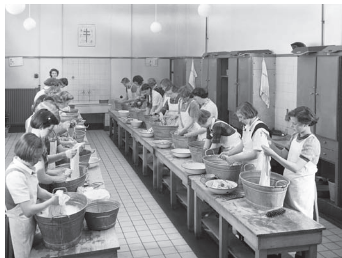
74.031. Polyvisie. Waslokaal in een huishoudschool, 1953

Het beeldarchief van Polyvisie bestaat zoals gezegd uit circa zeven miljoen