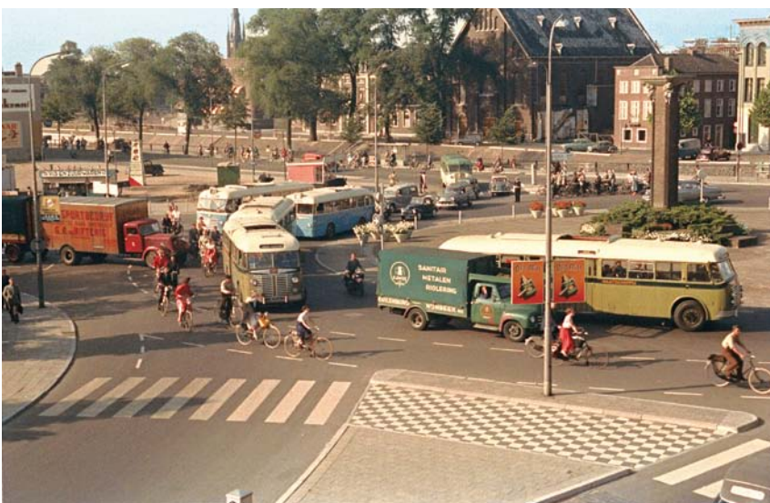
74.032. Polyvisie. Smakelaarsveld, Utrecht, circa 1955

Geluk zit in kleine dingen. Naast alle tijd en geld die de afgelopen jaren in