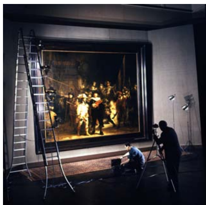
74.035. Polyvisie. Werkopname diaserie De nachtwacht , Amsterdam, circa 1960

Polyvisie is gestopt, blijft die dooddoener omverkort van kracht. Binnen deze context zijn die kleine dingen voor mij letterlijk de stukjes emulsie van 36 bij 24 millimeter, waarin het verleden op een zeer gevarieerde manier tot leven komt. Want ook buiten de educatieve series zijn de gefotografeerde onderwerpen van een grote diversiteit en leveren ze dagelijks nieuwe verrassingen op; een rondreis