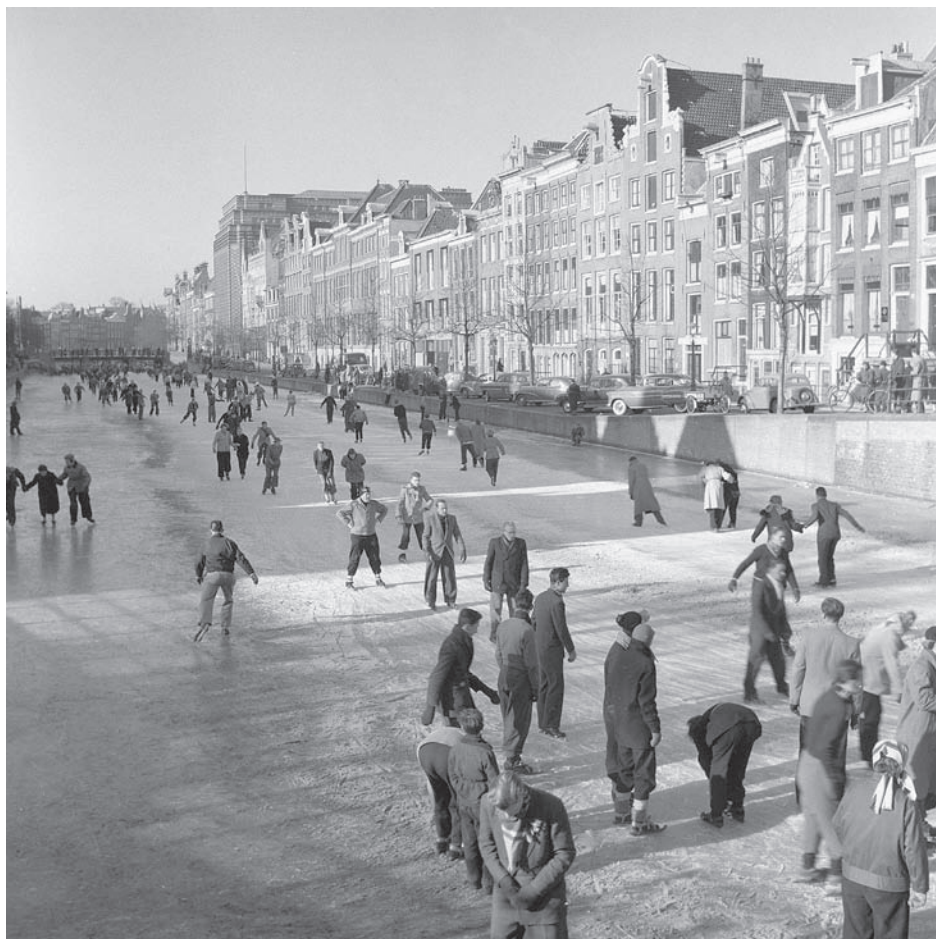
74.034. Polyvisie. Schaatsen op een gracht in Amsterdam, 1954

N.B.: De getoonde foto's zijn scans, gemaakt van kopieën die zijn gebruikt bij het testen van scanapparatuur. Origineel materiaal scan ik, uit voorzorg, alleen wanneer het structureel gebeurt. Daarbij wordt tegelijk het gehele object (een rol of een vergelijkbare eenheid) gescand en omgepakt, zodat het slechts eenmalig ter hand hoeft te worden genomen.